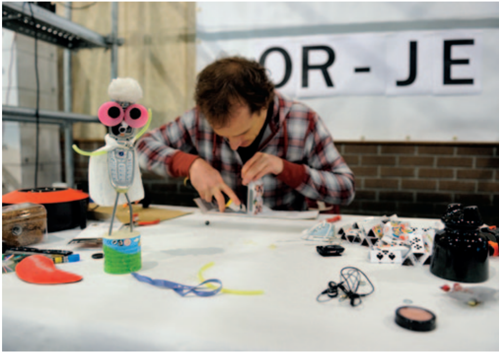
Création devant le public.