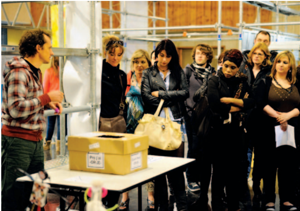
Accueil de groupes de personnes en situation de handicap ou en réinsertion professionnelle