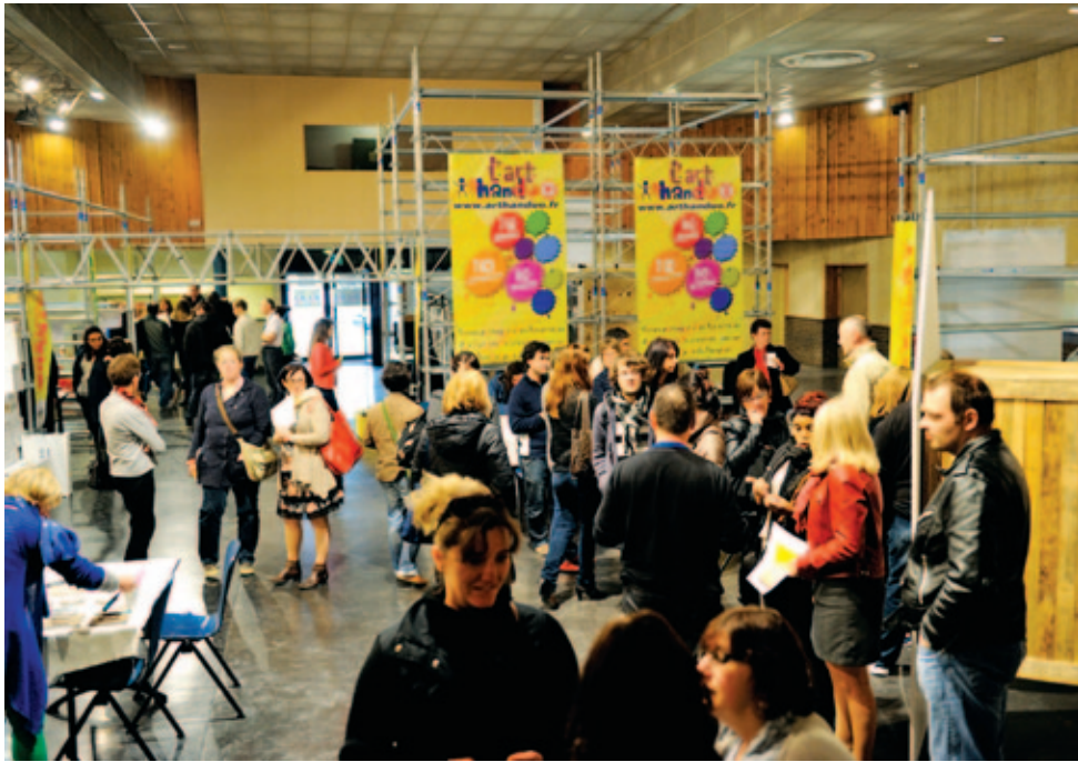
Le projet OR-JE a reçu le prix Nouveau regard.